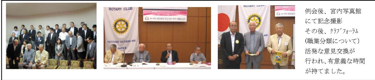
例会後、宮内写真館 にて記念撮影 その後、クラブフォーラム (職業分類について) 活発な意見交換が 行われ、有意義な時間 が持てました。